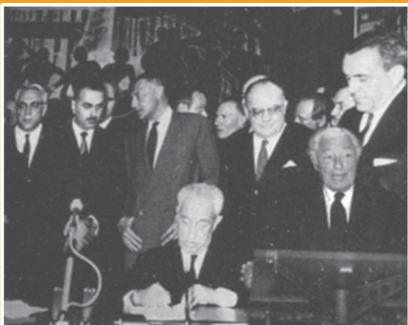
Подписание протокола о строительстве ВАЗ в Тольятти. Турин, 1969 г.

ческого сотрудничества с зарубежными странами, будучи заместителем председателя Государственного комитета по науке и технике. Глядя на плоды его трудов, еще раз убеждаешься, что не место красит человека. Не высокая должность, но чрезвычайный его талант — привлекать к себе людей, вступать с ними в подлинно дружеские отношения — позволил ему установить такие близкие, неформальные связи с руководителями многих зарубежных стран и представителями крупного бизнеса, которые обусловили формирование невиданных в те давние времена совместных проектов. Например, строительство автомобильного завода в Тольятти, выпускающего автомобили «Жигули», и появление в СССР цветного телевидения — целиком заслуга академика Гвишиани. И еще сотни таких же необыкновенно полезных и общественно значимых проектов были осуществлены под его непосредственным руководством.