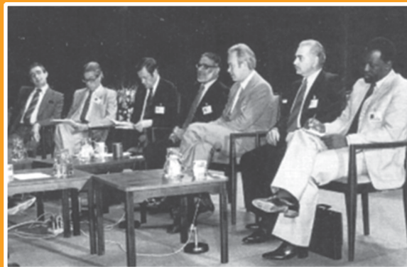
Глава советской делегации на конференции ООН по науке и технике в целях развития Д.М. Гвишиани с участием телевизионной программы «Большой шаг вперед», организованной Секретариатом ООН, 28 августа 1979 г.

Окидывая взглядом жизнь академика Гвишиани, невольно поражаешься тому, как много он успел