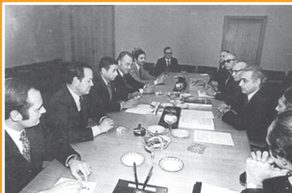
Беседа в ГКНТ с руководством фирмы «Филип Моррис». 1976 г.

Вместо этого он поступил на службу в военно-морской флот. Об этом он нам рассказывал не один раз, всегда подчеркивая, что служба во флоте дала ему очень много, повлияла на станов-