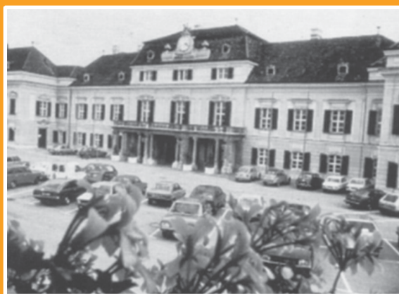
Замок Лаксенбург. Международный институт прикладного системного анализа (ИИАСА, ИАСА)

По разным причинам директора института время от времени менялись, но члены совета в течение 15 лет неизменно избирали своим председателем Д.М. Гвишиани. Это очень символично, если учесть, что в составе института и его совета работали представители полутора десятков стран! Казалось бы, они должны были находиться в естественных противоречиях, задаваемых разницей в культуре, менталитете, привычках, национальных поведенческих особенностях. Однако благодаря усилиям Джермена Михайловича была создана атмосфера доброжелательности, взаимопонимания, особая деловая обстановка, которую сотрудники института стали называть духом ИАСА ( International Institute for Applied Systems Analysis ) и которой чрезвычайно дорожили! Этот дух оставался неизменным всегда, даже в очень трудные для института времена, например, когда Соединенные Штаты отказывались выплачивать свою часть ежегодного финансирования.