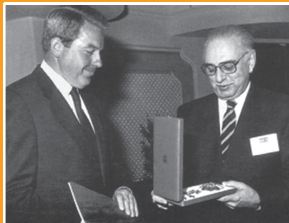
Канцлер Австрии Франц Враницкий вручает Д.М. Гвишиани высший национальный орден Австрии «Большой Золотой знак почета со Звездой»

Как это часто бывает с сильными духом людьми, трудности придавали Джермену Михайловичу Гвишиани дополнительные силы, побуждали его к активным практическим действиям. В 1976 г. он создает Всесоюзный научно-исследовательский институт системных исследований Российской академии наук (потом он будет переименован в Институт системного анализа РАН) и возглавляет совет Международного ин-